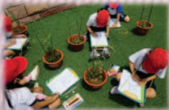
生活科の学習の様子