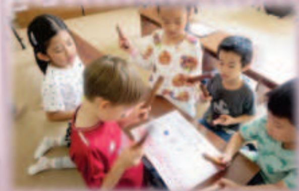
音楽の学習の様子