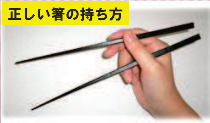
正しい箸の持ち方