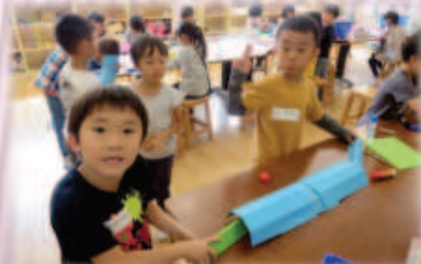
図画工作の学習の様子