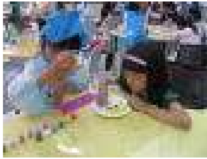
【面の色塗りを教えてもらう様子】