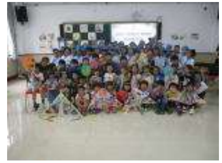
【みんなで記念撮影】