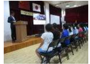
【親子進路学習会の様子】

義務教育を終える中学生という時期に、進路を考えること、将来を考えることは大切なことです。6月21日（金）親子進路学習会を行いました。本校では、キャリア教育を通して、将来の職業や自己の生き方について考え、社会の一員としての望ましい在り方を学んでいます。またこの日、具体的に進路を選択するために、今そして今後、どのようなことをしていけば良いのかを学び、考えることができました。