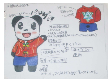
【マスコットキャラクター】

“連連（レンレン）”“パンダイヤ”“チャンダ”の中から“連連（レンレン）”と決定しました。大連の連からつけられたそうです。愛着をもってほしいと思います。