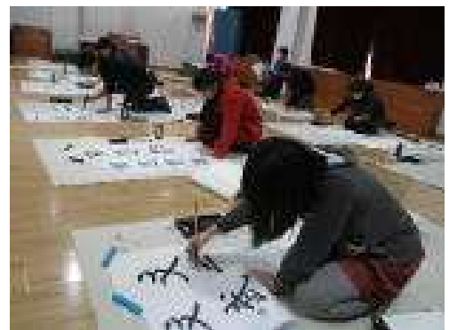
【書き初め大会の様子】

学校では1月11日（金）に書き初め大会を行いました。「新年を迎え、あらたまった気持ちで字の意味を考えながら書くと良いと思います。」と私から話をしました。講堂や教室には、じっくりと時間をかけて一文字一文字丁寧に書き上げる子どもたちの姿がありました。