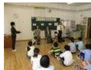
【キャリア教育講演会の開会式】