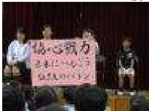
【後期のテーマを発表する役員】

後期第1回の定期総会が開かれました。まず立候補者から「全校の交流や季節に合ったイベントを行うなど、活動を増やしたい」「みんなが楽しく通うことができる学校にしたい」「新しいことに挑み、成功させることでみんなの笑顔を増やしたい」などと抱負が述べられました。その後、各役員に立候補した児童生徒が信任され、後期の児童生徒会が発足しました。新役員から「後期の児童生徒会も、前期のテーマ『協心戮力(きょうしんりく) ~未来へつなごう伝統のバトン~』を引き継ぎつつ、新しいことにも挑戦できるように、更に一人一人が意識を高めていきましょう」と、話がありました。