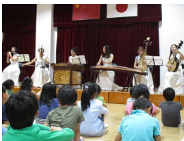
【夢幻女子楽坊さんの演奏】

28日には、夢幻女子楽坊さんをお迎えし、中国の伝統楽器である古箏、二胡、琵琶、竹笛、中元、柳琴の演奏を鑑賞しました。中国の曲だけでなく、日本の曲も演奏していただき、中国と日本の文化が融合した素敵なハーモニーを聴くことができました。「聴きなれている日本の曲でも、演奏する楽器によって雰囲気はこんなに変わるんだなあ」と感想を述べる子もいました。