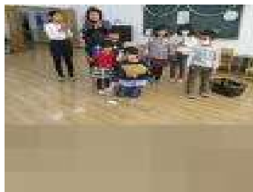
【なかよし集会の様子】

「つくろう世界一の笑顔 楽しもうみんな」をテーマに、中央役員の児童生徒が企画・運営を行いました。今回は、問題を解いたり課題を成功させたりする「ミッション」をクリアすることに、縦割り班の子どもたちが挑戦し競い合いました。幼稚園・小学部・中学部の子で編成された縦割り班では、触れ合い協力し合う活動を通して、仲良くなり友達の絆を深めることができました。また、ただミッションをクリアすればよい