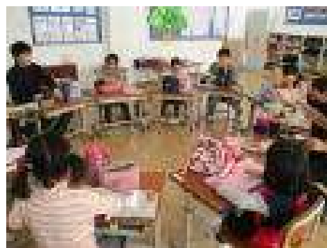
【合同昼食会の様子】

1月17日（水）に予定されていたなかよし集会ですが、体調を崩す子が多いことに配慮し、2月14日（水）に延期となりました。