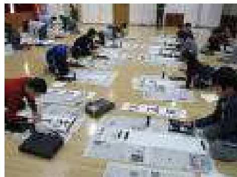
【書き初め大会の様子】

昔、正月2日は事始め仕事始めとして、その年の労働の安全や技能の上達を願うならわしがありました。正月2日から始めると上達が早いといわれ、この日に書き初めをすることで、字や絵の上達を願う意味があります。そして、その年の心構えや抱負などを書き記し、精進するとうまくいくといわれています。