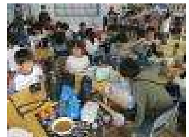
【カレー昼食会の様子】

12月7日・8日の2日間、PTA主催のカレー昼食会が行われました。2日間に延べ72名の保護者の皆様にお集まりいただき、子どもたちにカレーを作っていただきました。愛情がたっぷり注がれたカレーに、子どもたちからは予想以上の反響があり、皆笑顔で「おいしい、おいしい。」と温かいカレーを食べていました。学校中に笑顔があふれる素敵なひとときをありがとうございました。