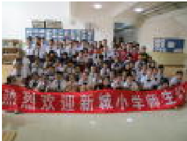
【みんなで記念撮影】

6月26日（月）に、本校の4年生が新城小学の4年生と交流会を行いました。歓迎の開会式の後、日本の文化や習慣、行事などをパネルで発表しました。その後、体験コーナーでは、福笑い、けん玉、折り紙などを教え、一緒に楽しい一時を過ごしました。新城小学の子に手振りや身振りで何とか