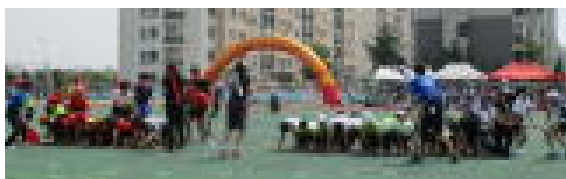
【いなばのうさぎたち】